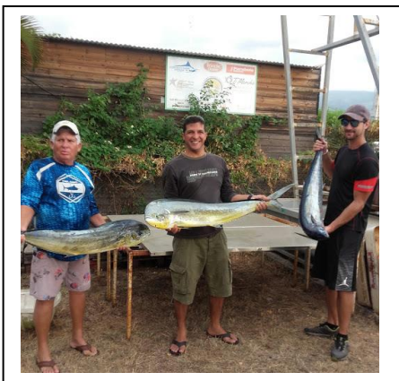
Les 2 coryphènes et le Wahoo d'EMY

La 7 ème journée, avec une météo défavorable, les équipages de EMY, avec 2 belles coryphènes, de THALIE avec un marlin bleu de 84 kg et EQUINOXE avec un marlin noir de 182,5 kg (combat de 10 heures 30 mn)