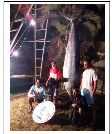
EQUINOXE arrivé à 22h30 au PC